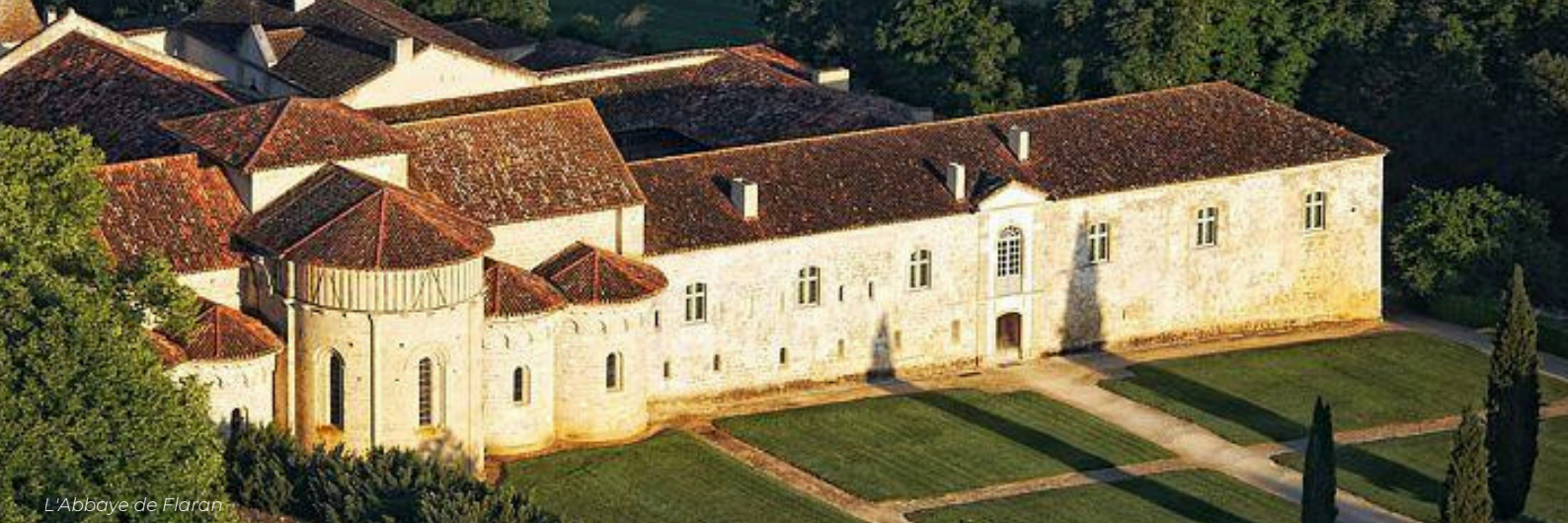
L'Abbaye de Flaran