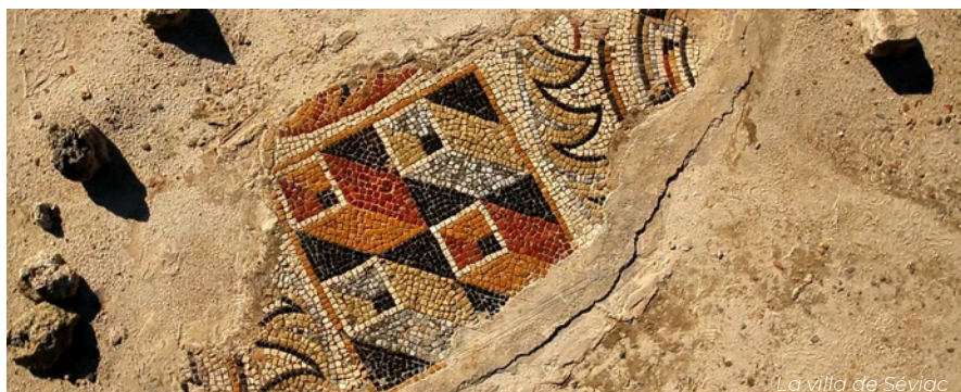
La villa de Séviac