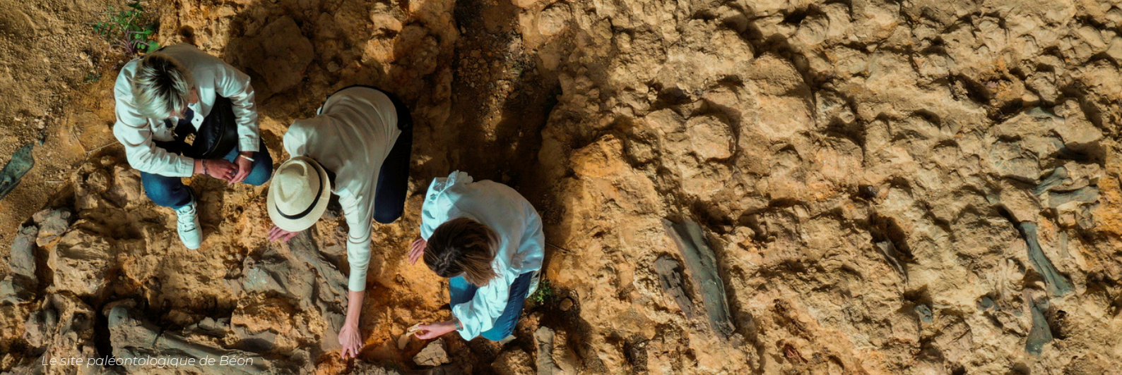
Le site paléontologique de Béon